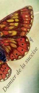
Damier de la succise