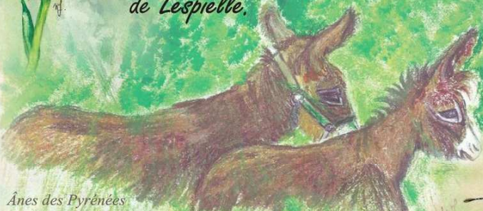
Ânes des Pyrénées

Sur le canton de Lembeye, environ 90 hectares sont aujourd'hui gérés en partenariat entre la Communauté des Communes du Canton de Lembeye et le CEN Aquitaine.